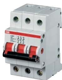
2CDC 051 002 R004